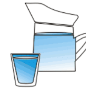
un verre d'eau