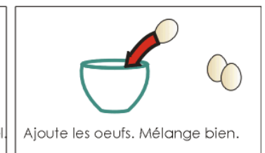
Ajoute les oeufs. Mélange bien.