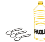
3 cuillères d'huile