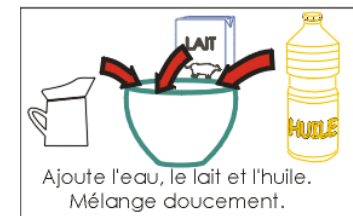
Ajoute l'eau, le lait et l'huile. Mélange doucement.