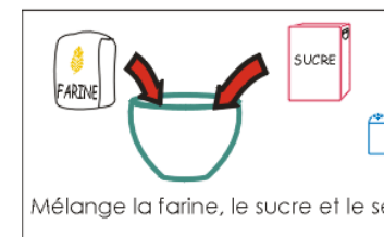
Mélange la farine, le sucre et le sel.