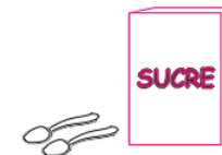
2 cuillères de sucre