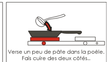
Verse un peu de pâte dans la poêle. Fais cuire des deux côtés..